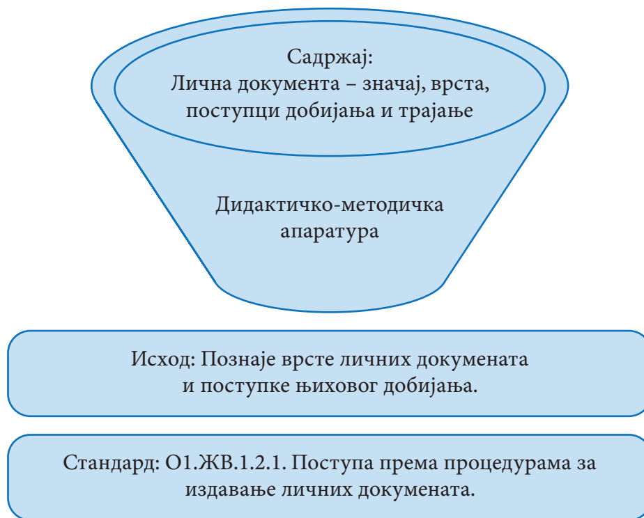
Фигура 1: Пример повезаности курикулума и образовних стандарда